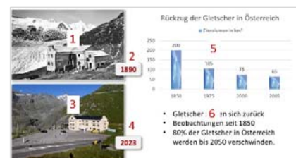
Animation - Reihenfolge