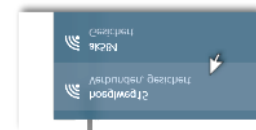
Gesichertes WLAN mit Verschlüsselung