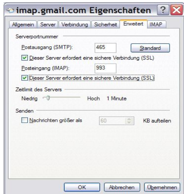
Abbildung 2: Erweiterte Einstellungen